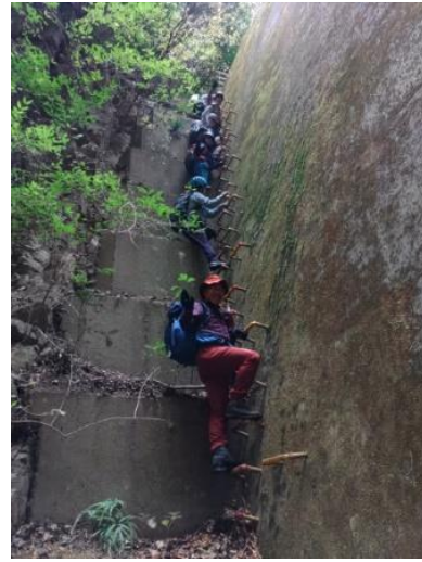
まだまだ登るホチキス