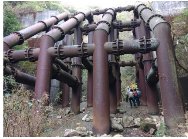
ふたつめのモビルスーツ