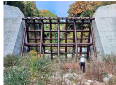
鋼製堰堤 (モビルスーツ)