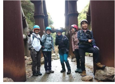
地獄大好き五人娘