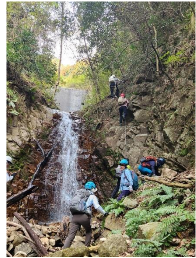
谷の雰囲気を感じて