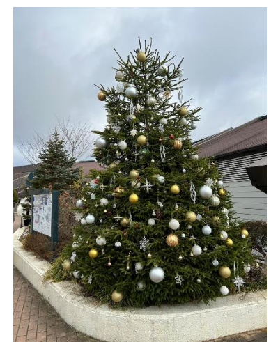
メリークリスマス もうすぐサンタがやってくる ガーデンテラスで昼食です