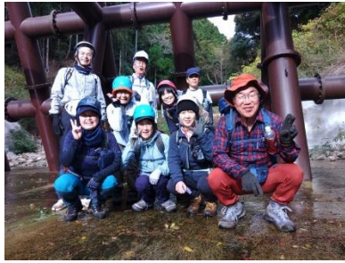
まだまだ余裕の9名