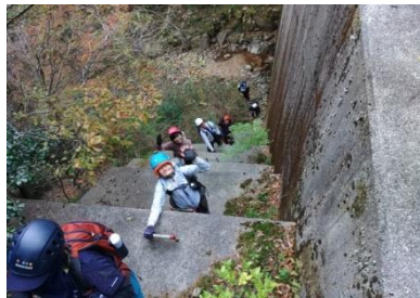
いろんなホチキスあります