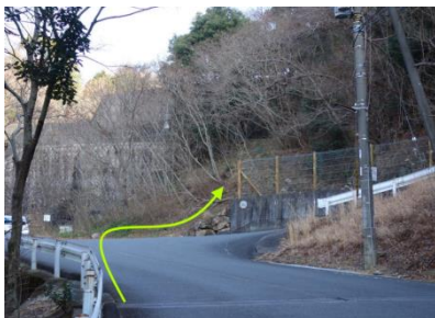
ヘアピンカーブ矢印が登山口

激登、激下り、ホッチキス、そして石切道から見たきれいな紅葉、とても楽しい山行でした！