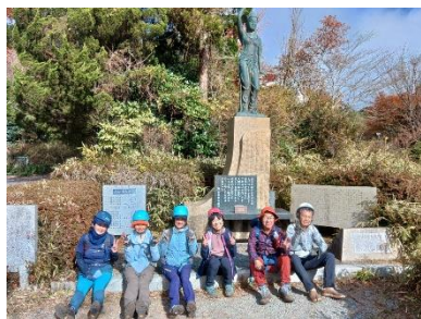
みよし観音 最後の急登を登り切って